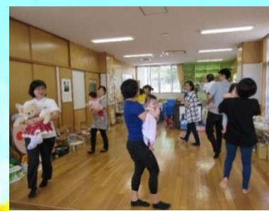
親子で楽しいリズム遊び