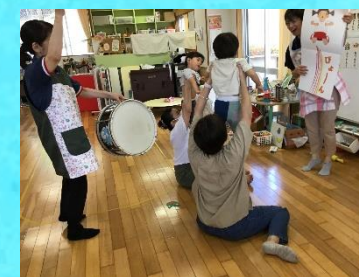
楽器を使って 絵本の読み聞かせ