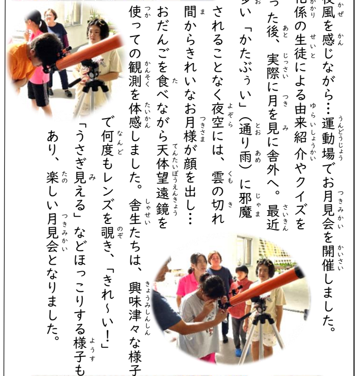
つきみ さいこう 月見だんご最高!

秋の夜風を感じながら...運動場でお月見会を開催しました。文化系の生徒による由来紹介やクイズを行った後、実際に月を見に舎外へ。最近多い「かたぶい」(通り雨)に邪魔されることなく夜空には、雲の切れ間からきれいなお月様が顔を出し...おだんごを食べながら天体望遠鏡を使つての観測を体感しました。舎生たちは、興味津々な様子で何度もレンズを覗き、「きれい!」「うさぎ見える」などほっこりする様子もあり、楽しい月見会となりました。