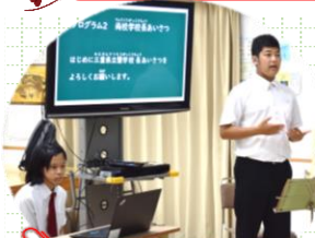
司会やPC操作を担当した文化係メンバー

4年目を迎えた三重県立聾学校寄宿舎とのオンライン交流会(1学期)が開催されました。今年から佐賀県立ろう学校寄宿舎も加わり、3校での友好を深めることになりました。第1回は、両校校長あいさつに始まり、自己紹介、佐賀ろう