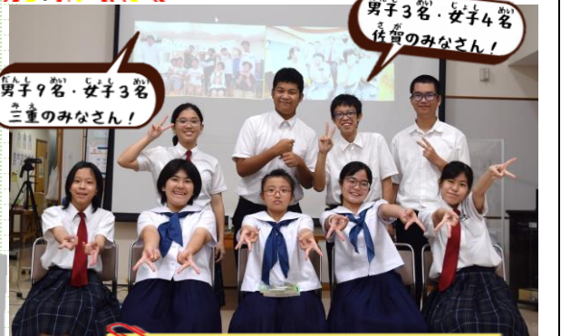
三重・佐賀のみなさん!よろしくね★