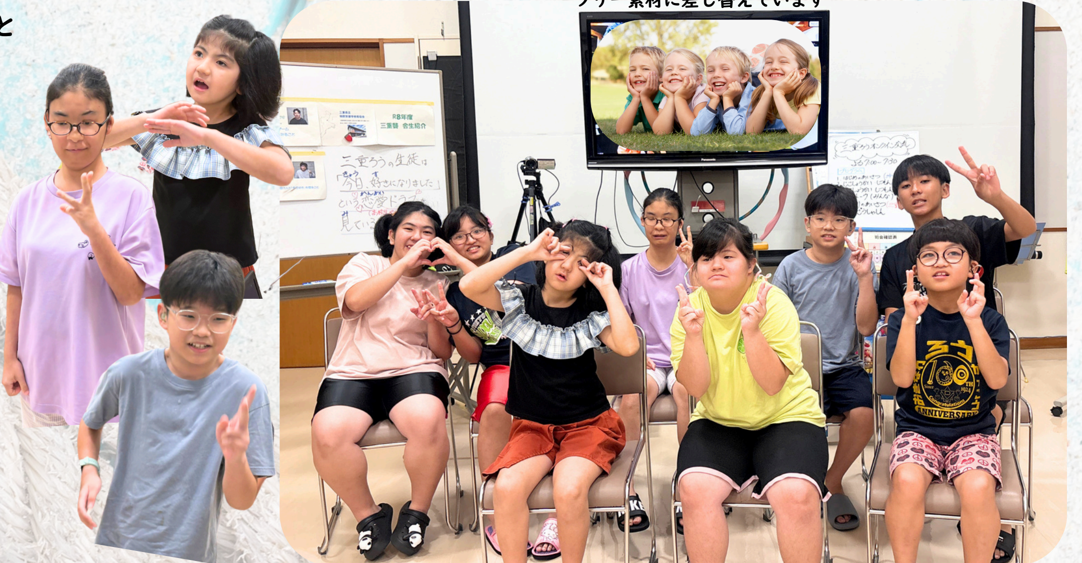
三重の写真は載せられないのでフリー素材に差し替えています